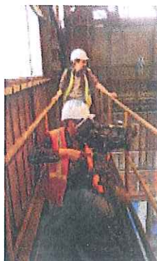
L'équipe de tournage.